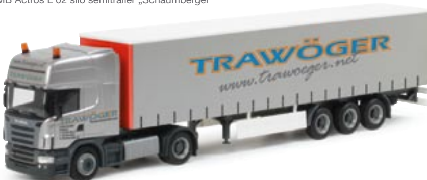
151979 || Scania R TL Gardinenplanen-Sattelzug „Trawöger“ (A) Scania R TL curtain canvas semitrailer „Trawöger“ (A)