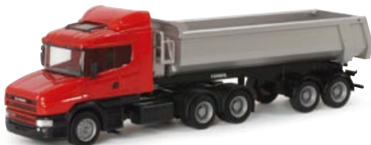
151894 || Scania Hauber 04 Rundmulden-Sattelzug Scania conventional 04 dump semitrailer