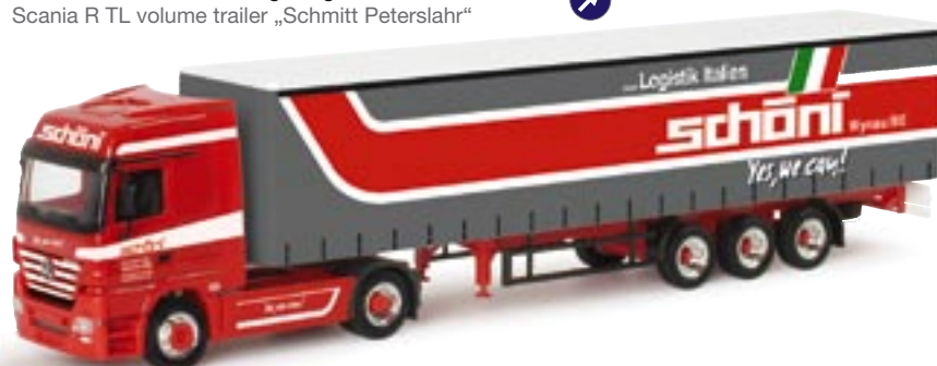
151887 || MB Actros LH 02 Gardinenplanen-Sattelzug „Schöni/Italien“ (CH) MB Actros LH 02 curtain canvas semitrailer „Schöni/Italien“ (CH)