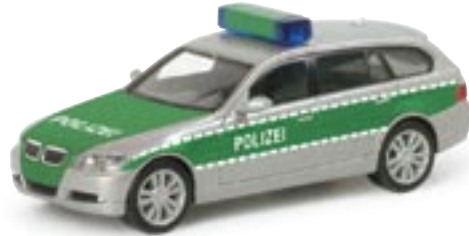
046923 || BMW 3er Touring™ „Polizei“