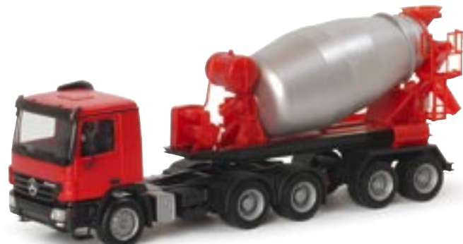
151788 || MB Actros M 02 Betonmischer-Sattelzug MB Actros M 02 cement mixer semitrailer