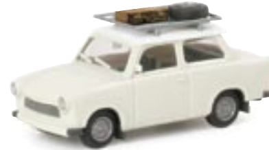
023450 || Trabant 601 „On Tour“

„ Auto Emoción “ is the motto of the new Seat Leon , presented to the public by Herpa during the IAA 2005 . The sportive vehicle, with all its details, was reproduced by Herpa in exact 1/87 th scale and will be available in the colors blue and metallic silver.