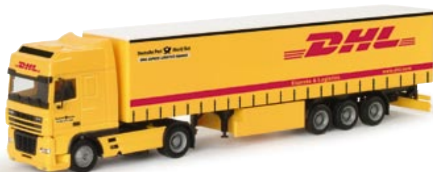
151856 || DAF XF SSC Gardinenplanen-Sattelzug „DHL“ DAF XF SSC curtain canvas semitrailer „DHL“