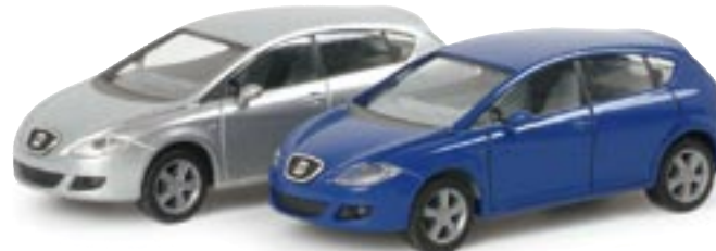
023474 || Seat Leon standard 033473 || Seat Leon metallic