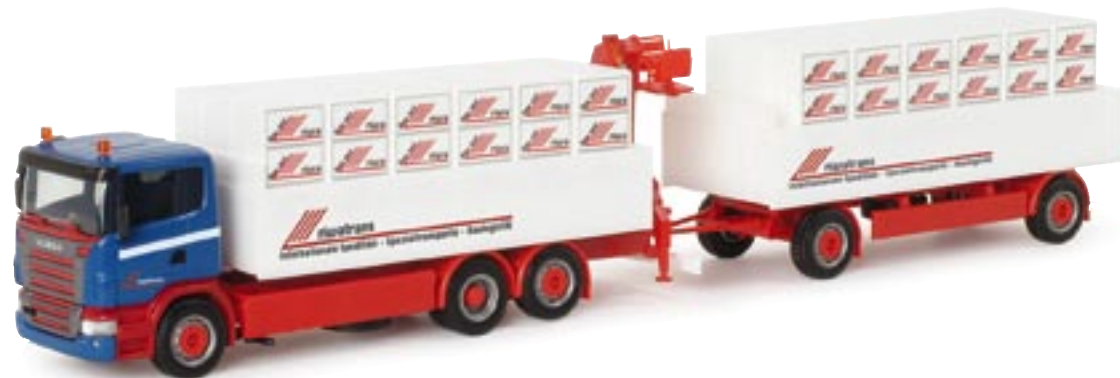
151900 || Scania M 04 Baustoff-Hängerzug „Riwatrans“ Scania M 04 pick-up trailer „Riwatrans“