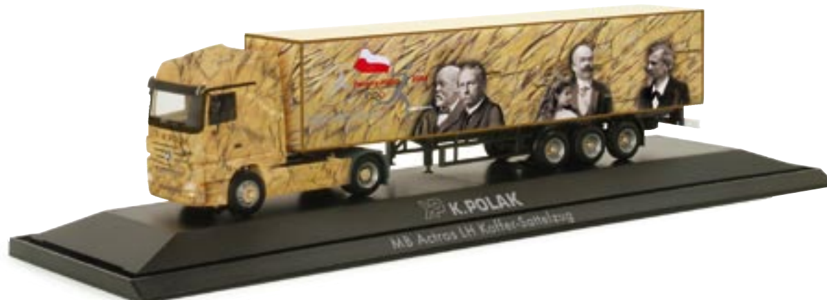
120784 || MB Actros LH 02 Koffer-Sattelzug „K.Polak“ (PL) MB Actros LH 02 box semitrailer „K.Polak“ (PL)