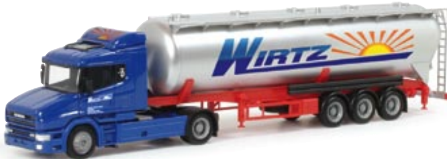
151931 || Scania Hauber Silo-Sattelzug „Wirtz“ Scania Hauber silo semitrailer „Wirtz“