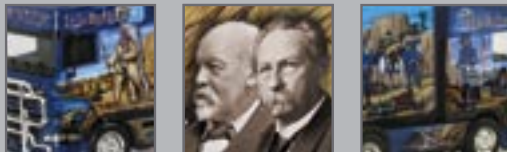
120777 || DAF XF SSC Gardinenplanen-Sattelzug „Nowotny Transporte / Little Big Horn“

Im Jahre 1992 wurde die Fa. Nowotny Transporte gegründet. Das in Ludwigsburg ansässige Unternehmen hat von dem Airbrush-Künstler Lothar Bohn einen Gardinenplansattelzug mit DAF XF Zugmaschine gestalten lassen, der unter dem Namen „ Little Big Horn “ künftig unterwegs sein wird. Herpa realisiert den Showtruck in der bekannten Private Collection Vitrine in einer einmaligen Auflage.