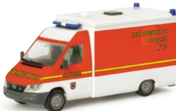
046947 || MB Sprinter RTW „Rettungsdienst Pinneberg“