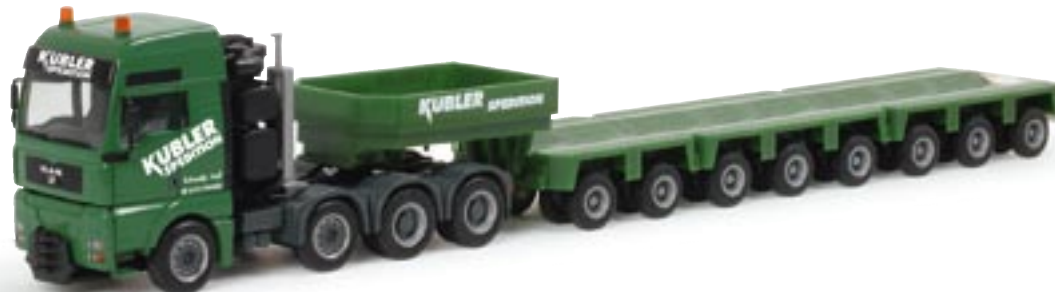
151993 || MAN TGA XXL Tieflade-Sattelzug „Kübler“ MAN TGA XXL low-boy semitrailer „Kübler“

Seven axles support this MB Actros LH curtain tarp semitrailer, operated by the Bender Transportation Company in Freudenberg. The company has been operating in local, long-haul and specialized transports for the past 55 years. The new Herpa model is painted completely silver a released in a limited edition. Further models in this company design are to follow middle 2006.