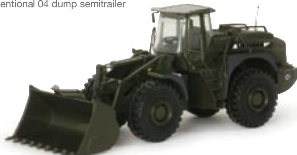
151962 || Liebherr Radlader „Bundeswehr“ Liebherr wheel loader „Bundeswehr“