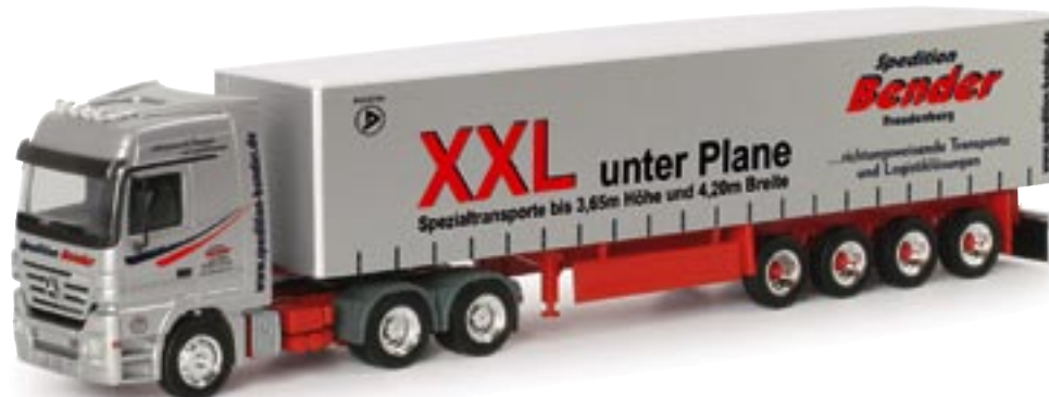
151955 || MB Actros LH 02 Gardinenplanen-Sattelzug „Bender“ MB Actros LH 02 curtain canvas semitrailer „Bender“