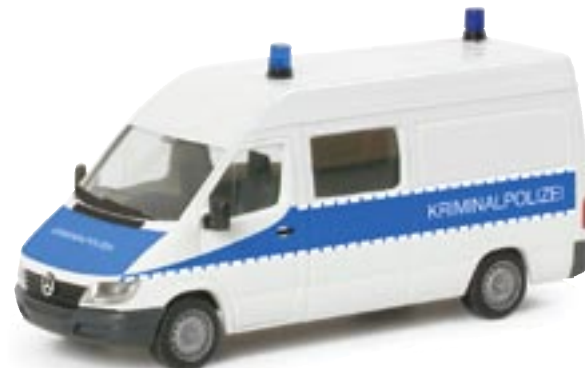
046954 || MB Sprinter HD „Kriminalpolizei Brandenburg“

The German State North-Rhine Westphalia transports its convict inmates to court or to other prison facilities using this MB Sprinter. It is the latest supplement to the range of Herpa police department vehicles. The white/green Mercedes Sprinter features only one window on the right side.