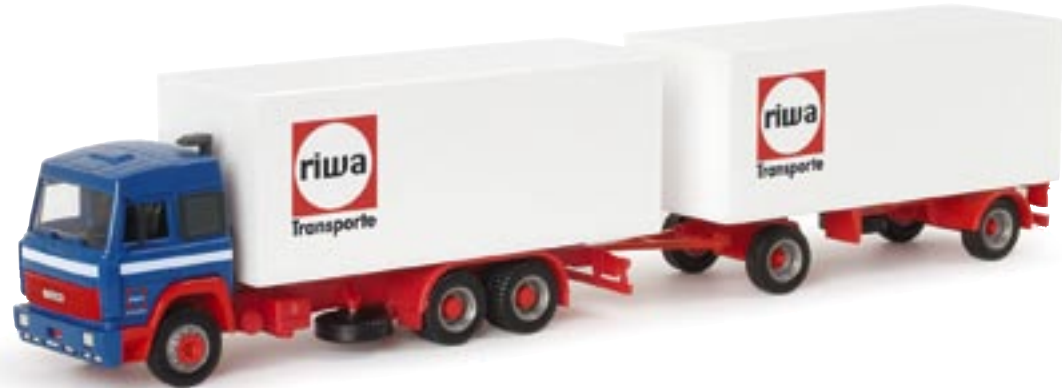
151870 || Iveco TS Koffer-Hängerzug „Riwatrans“ Iveco TS box trailer „Riwatrans“