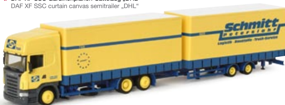
151863 || Scania R TL Volumen-Hängerzug „Schmitt Peterslahr“ Scania R TL volume trailer „Schmitt Peterslahr“