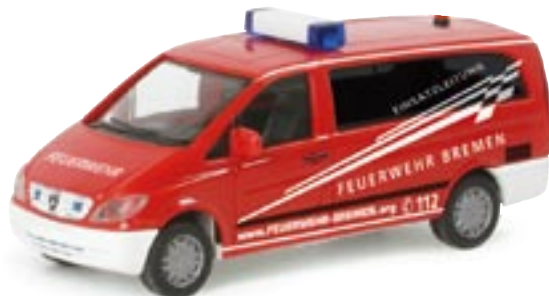
046893 || MB Vito Bus „Feuerwehr Bremen“