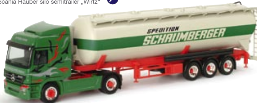
151948 || MB Actros L 02 Silo-Sattelzug „Schaumberger“ MB Actros L 02 silo semitrailer „Schaumberger“