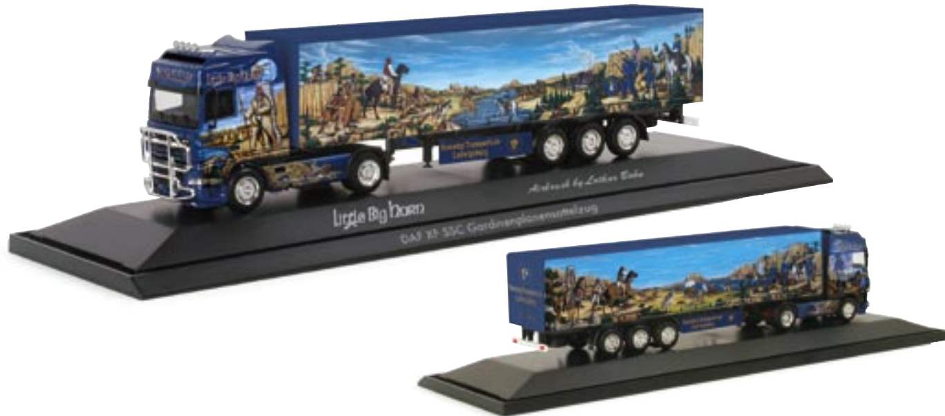
120777 || DAF XF SSC Gardinenplanen-Sattelzug „Nowotny/Little Big Horn“ DAF XF SSC curtain canvas semitrailer „Nowotny/Little Big Horn“