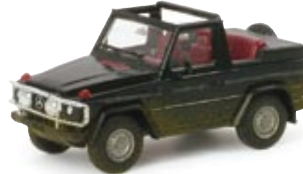
023467 || MB 300 GE Cabrio „Off Road“