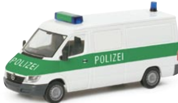
046909 || MB Sprinter FD „Polizei NRW / Gefangenentransporter“

The new 3-Series BMW Touring™ was presented to the public in a police-car variation at the IAA 2005. The Herpa model is an exact scale replication in metallic-silver color and also features the original Hella RTK 6 flashing light system.